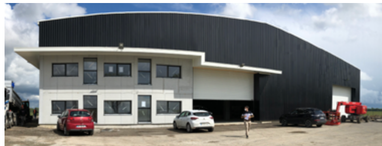
Première usine de préfabrication de murs en béton de chanvre sur ossature bois baptisée Wall'up.